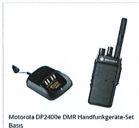
Motorola DP2400e DMR Handfunkgeräte-Set Basis