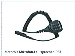
Motorola Mikrofon-Lautsprecher IP67