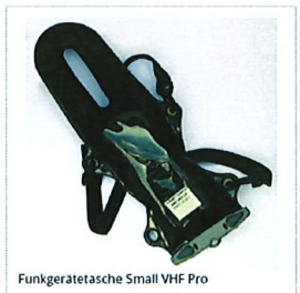
Funkgerätes tasche Small VHF Pro