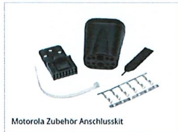
Motorola Zubehör Anschlusskit